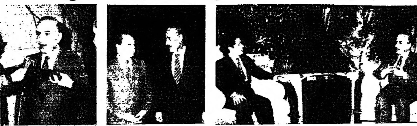
الجميل والحسيني في الاجتماع الأسبوعي (اللائي ونهرا)

كلف رئيس الجمهورية الشيخ أمين الجميل أمس المهندس عاصم قانصوه الأمين العام القطري لمنظمة حزب البعث العربي الاشتراكي نقل وجهة نظره ومقترحاته إلى المسؤولين السوريين حول مشروع الاتفاق الثلاثي الذي نشط التحرك حوله بين بيروت ومشرق. ولم تكشف المصادر المطلعة طبيعة هذه المقترحات معتبرة ان الكشف عنها يضر ولا يفيد. ومن جهته رئيس مجلس النواب السيد حسين الحسيني أعلن ان زيارته قصر بعبدا واجتماعه مع الرئيس الجميل أمس... ان لبنان الآن في حلحلة ان رجال دولة يتصلون مسؤوليتهم ولذا في حلحلة ان الكثير من رجال السياسة... وما كنا من انشاء ما سمي انذاك «قوات سعد حداد» واليوم تريد اسرائيل ان تلعب اللعبة ذاتها من حيث الانتشار من الشمال جنوبا لتتمكن من ترسيخ الحزام الأمني الذي تسعى اليه. هذا الأمر مرفوض كلية. ونحن نطالب الالتزام بميثاق القرار ٤٢٥ الذي تفتي اولاً بتمكين انسحاب اسرائيل حتى الحدود الدولية. وبالتالي انتشار القوات من الجنوب شمالاً. عند ذلك لا يعود هناك من تحفظات لجهة انتشار قوات الطوارئ. خصوصاً عندما تعلم ان هذه القوات هي بناء على طلب الحكومة اللبنانية. ولا يمكن ان نقبل بتحويلها قوات فصل بيننا وبين اسرائيل على ارضنا. خصوصاً ما مجرد اعلان اسرائيل ودعم اسرائيل ما يسمى جيش الحداد. انما هو الخرق الفاضح للمواثيق الدولية ولا يمكن التسليم لهذا الخرق. لأنه يشكل سابقة خطيرة ليس على صعيد لبنان نفسه، وانما على الصعيد العالمي بأسره. إذ كيف يمكن السماح لدولة بأن تفتق جيشها على اراضي الغير؟ وهل تتوقف هذه الدولة عند الاضرار بلبنان؟ انني اعتقد ان هذا العمل يعرض الاسرة الدولية والمؤسسات الدولية لخطر انعدام مصداقيتها واتخاذ مبدل وجوهلها.